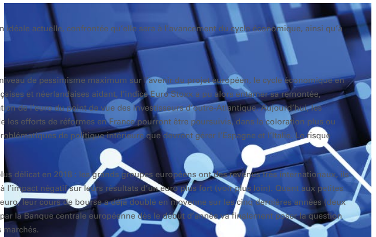
CONDITIONS FINANCIÈRES EN ZONE EURO ET AUX ÉTATS-UNIS

Profiter boursièrement de cette embellie économique européenne va toutefois s'avérer plus délicat en 2018 : les grands groupes européens ont des revenus très internationaux, ils sont donc relativement peu sensibles au rebond économique européen, et sont exposés à l'impact négatif sur leurs résultats d'un euro plus fort (voir plus loin). Quant aux petites et moyennes capitalisations, beaucoup plus en prise avec le rebond de l'activité en zone euro, leur cours de bourse a déjà doublé en moyenne sur les cinq dernières années (deux fois la performance de l'Euro Stoxx). Enfin, la réduction effective des achats obligataires par la Banque centrale européenne dès le début d'année va finalement poser la question de son impact concret sur les taux d'intérêt, et donc sur l'ensemble de la valorisation des marchés.